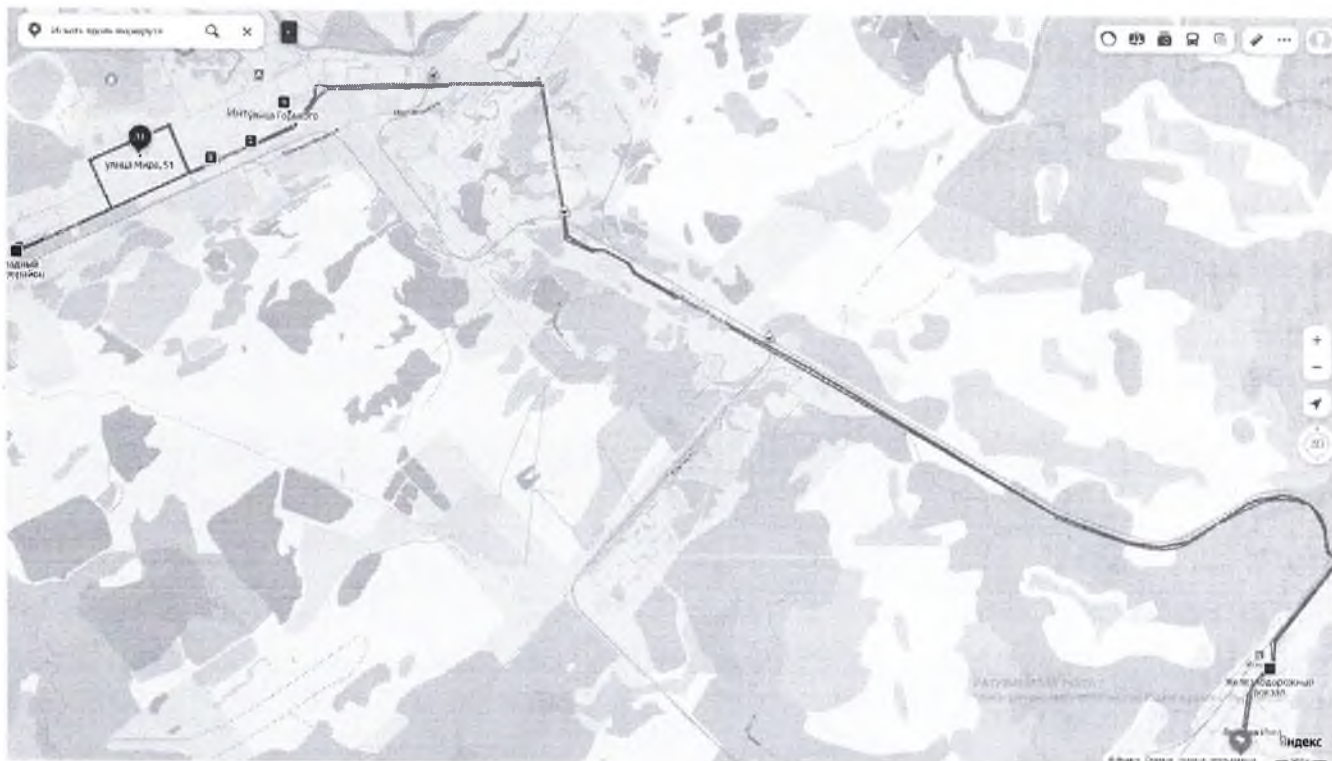
СХЕМА МАРШРУТА №6 ШКОЛЬНОГО АВТОБУСА